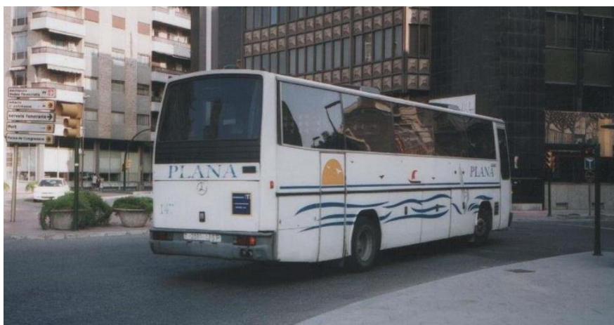
Bus_147-MB-O303_Obradors_(Ex-Salca)_2001-08(DAM).JPG → en Plana

En el año 1996 Plana se quedó una pequeña empresa denominada Salca que realizaba una línea que unía Tarragona con El Catllar, un pequeño pueblecito al norte de Tarragona. La empresa Salca disponía entonces de dos Obradors E-345 y un microbus Mercedes, el microbús Mercedes no llegó a pasar a Plana, fue vendido a la empresa Sant Martí y posteriormente a Rosanbus donde se encuentra realizando servicio para discapacitados. Los Obradors numerados como 147 y 148 pasaron a engrosar la flota de Plana, decir que el 148 fue retirado el año pasado, el 147 ya hace algunos años más, por lo que actualmente en Plana ya no queda ningún vestigio de Salca. Aquí la foto del 147.