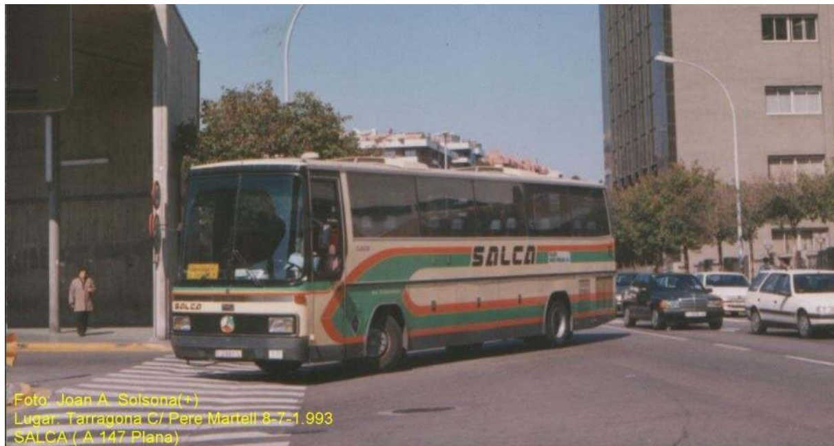
Lugar: Tarragona C/ Pere Marfà 8-7-1.993 SALCA (A 147 Plana)

El único documento gráfico que se ha conseguido de este entramado de empresas: